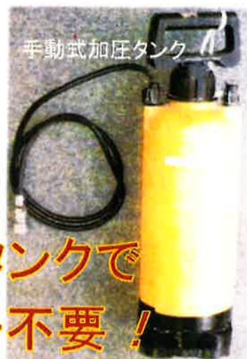
手動式加圧タンク